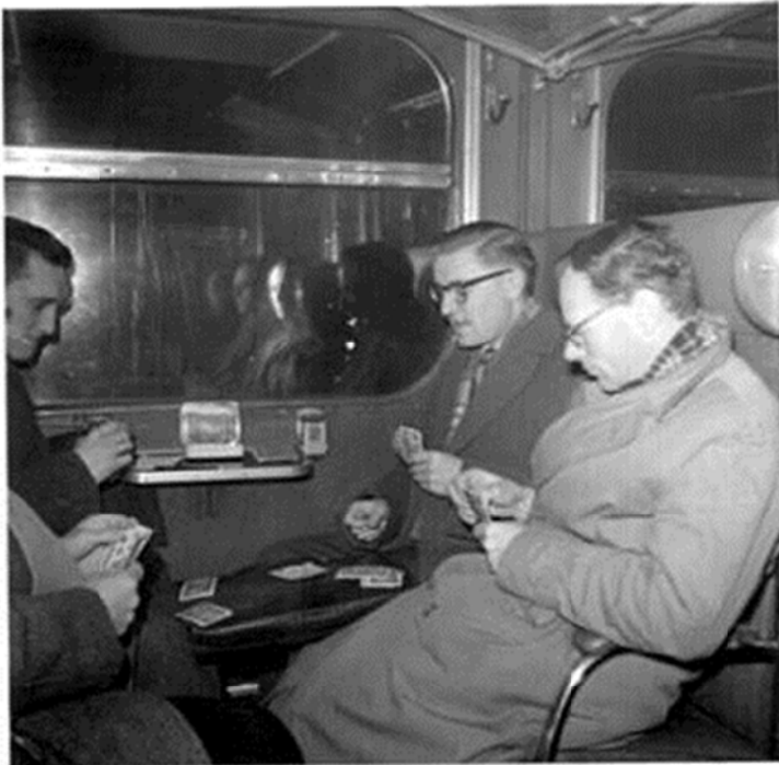
Trem naar Rldam

In 1952, het jaar waarin men ging samenwonen in de nieuwbouw aan het Weena te Rotterdam, werd aan dit drietal de stichting Ratiobouw als vierde toegevoegd.